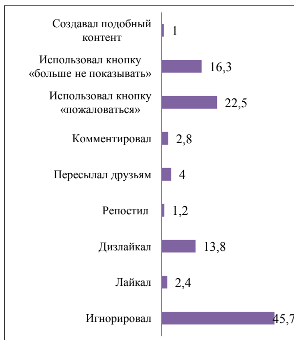
Рис. 2. Действия респондентов 15-25 лет по отношению к контенту с пропагандой экстремизма и терроризма (2019 г.), %

Кроме того, в интернете можно также столкнуться с призывами к несанкционированным действиям (нарушению порядка проведения собрания, митинга, демонстрации и т.д.): с таким контентом столкнулось 72% респондентов, из них 71% девушек и 74% юношей. Из тех, кто сталкивался с подобным контентом, больше половины просто игнорировало его, а каждый десятый дизлайкал и отправлял жалобу администрации ресурса.