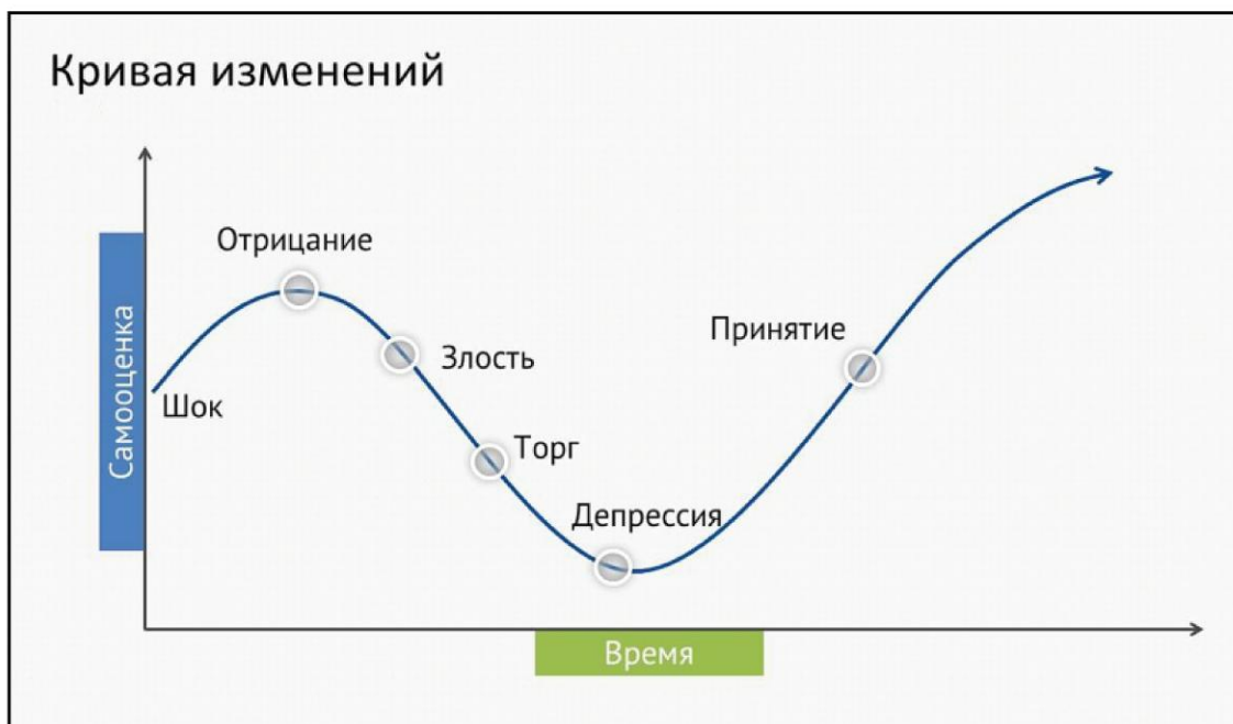
Рис. 1. Стадии переживания горя по Э. Кюблер-Росс

Считается, что нормальная реакция скорби может продолжаться до года. Это не значит, что человек может полностью восстановиться за это время и начать жить как ни в чем не бывало. Однако примерно за этот период проходят сильные реакции эмоционального реагирования на утрату, человек начинает потихоньку привыкать жить иначе и строить свою жизнь без умершего.