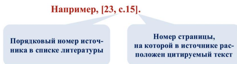
Рисунок 6 – Пример оформления концевой ссылки в курсовой работе

Если приводят не точный текст цитаты, а ее пересказ, цитату в кавычки не заключают, а ссылку на источник дают в конце заимствованного материала. Рекомендуется такой пересказ сопровождать оборотами типа «По мнению такого-то», «Как считает такой-то», «Как отмечает такой-то». Не допускается опущение инициалов перед фамилией исследователя (см. рис.6).