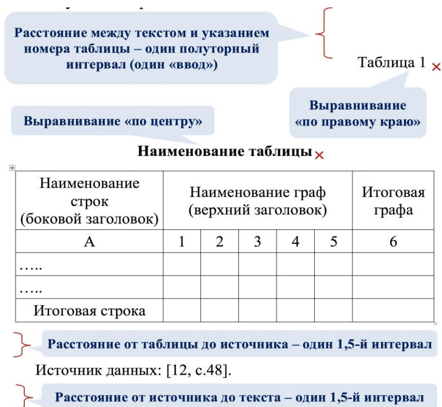
Рисунок 4 – Пример оформления таблицы в курсовой работе

Заголовки столбцов, как правило, записывают параллельно строкам таблицы, но при необходимости допускается их перпендикулярное расположение (см. рис.4).